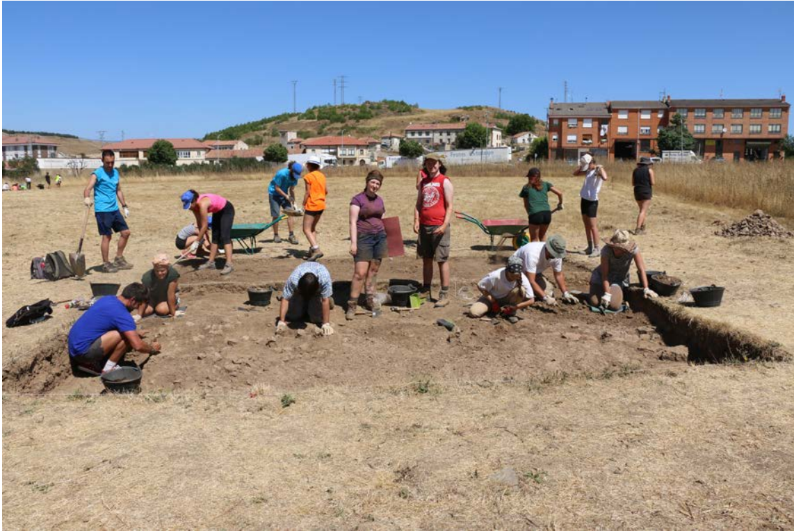
Alumnos de la Universidad de Edimburgo en la excavación del yacimiento de la Huerta Varona (Aguilar de Campoo, Palencia).

- Huerta Varona (Aguilar de Campoo, Palencia) es un yacimiento hispano-romano fundado durante las Guerras Cántabras por legiones romanas, siendo el origen de la actual población de Aguilar de Campoo. En uso durante varios siglos, fue abandonado al final del Imperio.