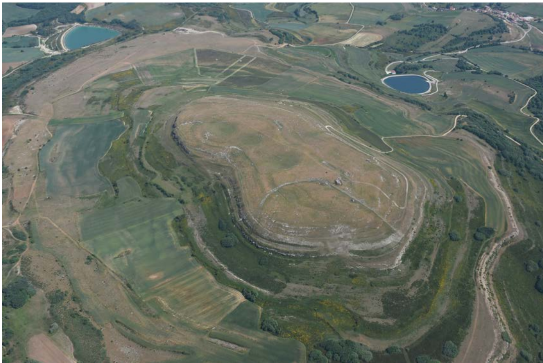
Vista aérea del yacimiento de Monte Bernorio.

- Monte Bernorio es una ciudad fortificada de la Edad del Hierro que fue habitada durante varios siglos a lo largo de la Edad del Hierro. Además, desempeñó un papel importante en las Guerras Cántabras contra Roma. La intervención arqueológica se centrará en este núcleo, realizando excavaciones y prospecciones. También se llevarán a cabo prospecciones y sondeos en otros yacimientos Protohistóricos, dentro del mismo proyecto.