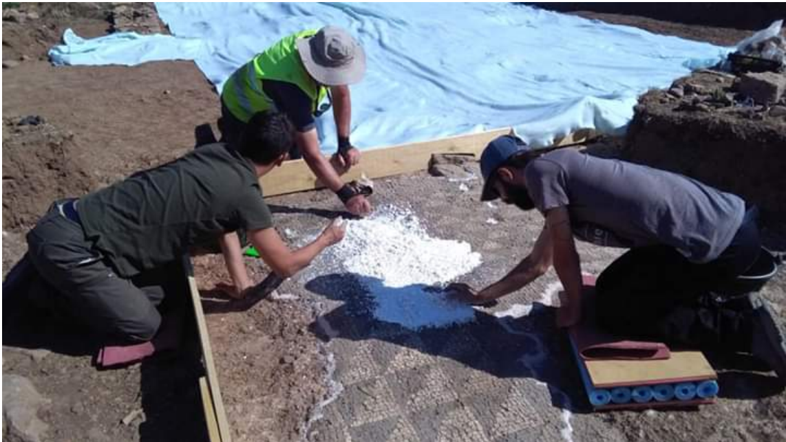
Trabajos de limpieza de mosaico romano en el yacimiento de Huerta Varona.