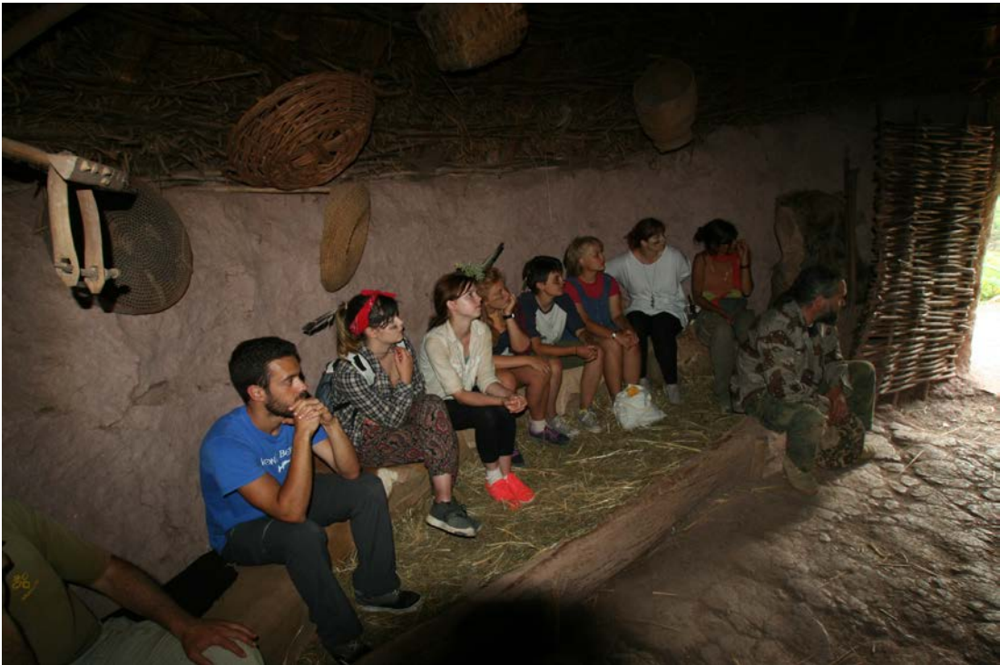
Alumnos de la Universidad de Edimburgo y de la Universidad Complutense de Madrid en una visita al Espacio de Arqueología Experimental del Poblado Cántabro de Argüeso.