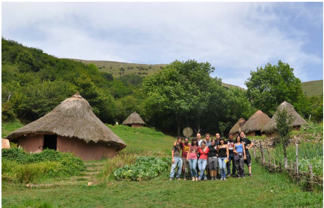
Visita de una de nuestras promociones de Investigadores en Formación en el Espacio de Arqueología Experimental del Poblado Cántabro de Argüeso.