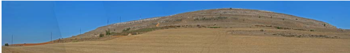
Vista del yacimiento de Monte Bernorio (Pomar de Valdivia, Palencia).